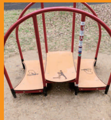
南区各所の公園に健康遊具を設置