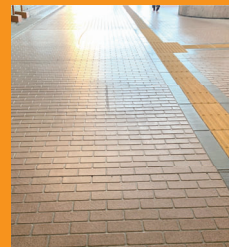
滑りにくい駅前通路の舗装