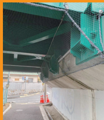
高架下通路のガラスネット整備