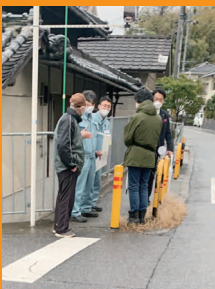
老朽化舗装の立会