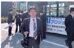
自動運転システム試乗 (大小路筋)

高齢者にはシニアカー、若い世代に電動キックボード、すべての世代に電動シェアサイクル、電動カートを活用した自動運転モビリティを泉北ニュータウンの特色である安全な緑道での活用を議会ごとに提案しています。また、南区各所から市民の皆様から1時間当たりのバス増便やより近隣のバス停の見直しの要望が多いことから実験中のオンデマンドバスをさらに進化させ乗降場所の増加、呼び出し時間短縮等さらに議論してまいります。