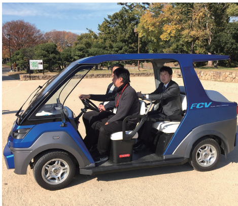
水素発電クリーンモビリティ試乗 (大仙公園)