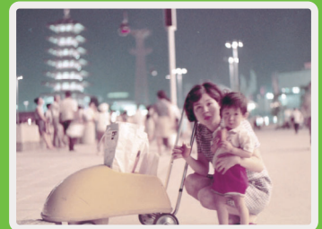
1970年大阪万博では私は1歳でした

しかし万博に抱く憧れは現実になりました！この大きな発展のチャンスをしっかりとしかりと堺の発展へ弾みをつけて参りたいと思います。