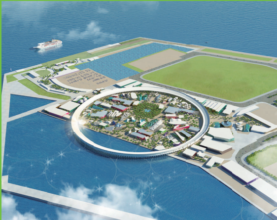
2025大阪関西万博 会場イメージ

府市連携のもとG7大阪・堺貿易大臣会合が誘致されます。この機会をとらえて2025年関西・大阪万博の機運醸成につなげることとビジター産業だけでなく堺市内の地場産業発展の起爆剤になるように本会議で質疑を行いました。合わせて70年代の万博を体験した世代として万博レガシー（最新技術、跡地、パビリオン）の活用を求め、テーマである健康・医療分野の発展を関西全体で受け取ることができるよう求めました。