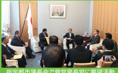
指定都市議長会で菅官房長官に要望活動