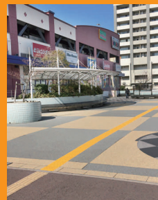
コムボックス前再舗装