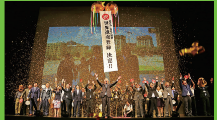
世界遺産登録決定 フェニーチェ堺にて