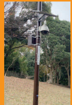
公園内の防犯カメラを増設